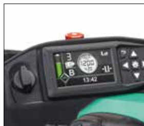
Pantalla multifunción en color

*** No disponible combinado con baterías de iones de litio