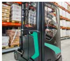
Cabina de almacenamiento en frío