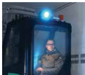
Luz de seguridad con foco azul