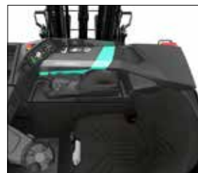
Asiento Grammer con cinturón de seguridad