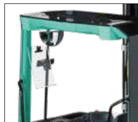
Retrovisor y soporte para listados A4